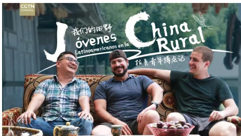
Gráfico 3. “Narradores en charlas”, Tres jóvenes narradores latinoamericanos mantienen un agradable intercambio en un patio de la aldea de Tianba. Cartel del documental Jóvenes Latinoamericanos en la China Rural